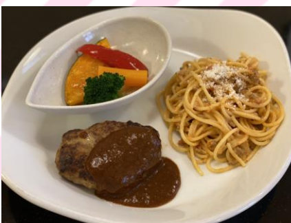
■プレートランチ 950円 (税抜864円) ハンバーグ120g、ポロネーゼ、 サラダ、ライス、カップスープ