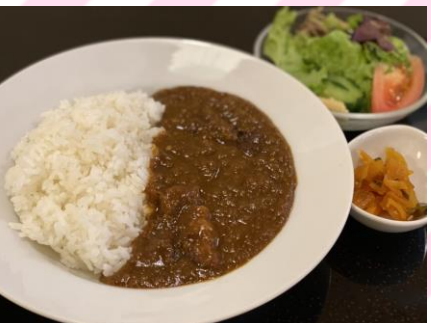
■カレーライス 700円 (税抜636円) カレーライス、サラダ、 カップスープ