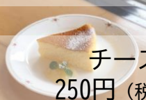
チーズケーキ 250円 (税抜227円)