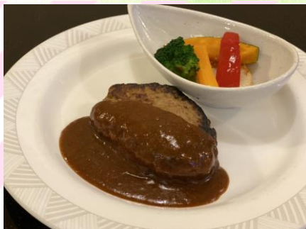
■ハンバーグランチ 700円 (税抜636円) ハンバーグ160g、ライス、 カップスープ

※食後にミニコーヒーをサービスいたします。 ※カレー・弁当・丼もの以外はご飯をパンに変更できます。 ※ランチタイムはご飯の大盛り無料です。