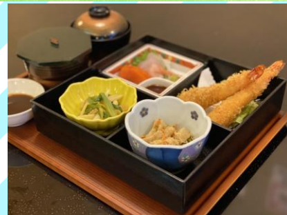
■エビフライ弁当 1100円 (税抜1000円) エビフライ2本、刺身、小鉢2種、 ごはん、味噌汁