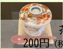
茶碗蒸し 200円 (税抜182円)