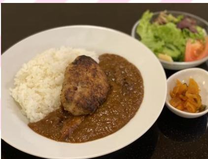
■ハンバーグカレー 1000円 (税抜909円) カレーライス、ハンバーグ120g、 サラダ、カップスープ