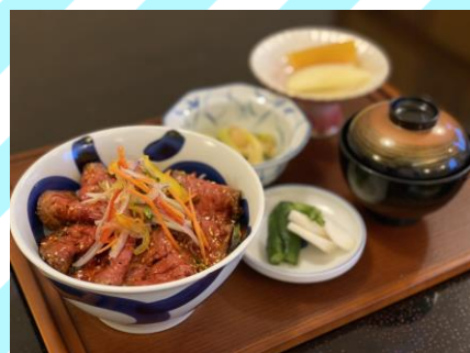
■ローストビーフ丼 1200円 (税抜1091円) 国産牛ランプローストビーフ丼、 小鉢、漬物、味噌汁、フルーツ