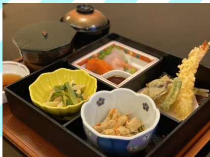
■天ぷら弁当 1000円 (税抜909円) 天ぷら(海老、キス、野菜2点)、 刺身、小鉢2種、ごはん、味噌汁