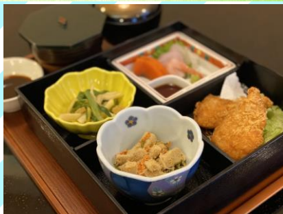
■とんかつ弁当 850円 (税抜773円) とんかつ30g2個、刺身、小鉢2種、 ごはん、味噌汁