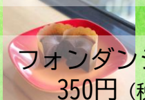
フォンダンショコラ 350円 (税抜318円)