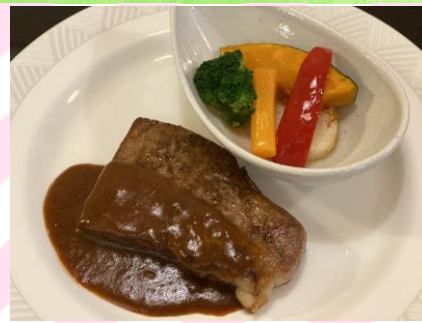
■サーロインステーキランチ 1600円 (税抜1455円) 国産牛サーロイン120g、ライス、 カップスープ