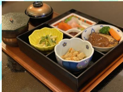
■ハンバーグ弁当 900円 (税抜818円) ハンバーグ120g、刺身、小鉢2種、 ごはん、味噌汁

※食後にミニコーヒーをサービスいたします。 ※カレー・弁当・丼ものの以外はご飯をパンに変更できます。 ※ランチタイムはご飯の大盛り無料です。