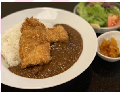
■カツカレー 900円 (税抜818円) カレーライス、ロースかつ30g2個、 サラダ、カップスープ