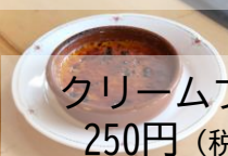
クリームブリュレ 250円 (税抜227円)