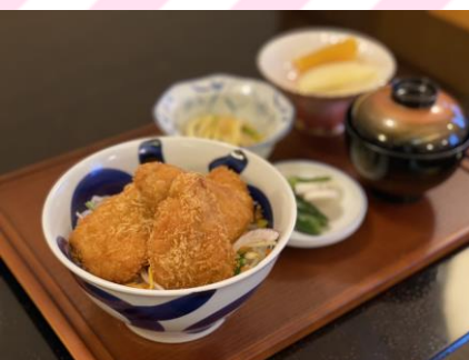
■新潟風タレかつ丼 900円 (税抜818円) かつ丼(ロースかつ30g4個)、 小鉢、漬物、味噌汁、フルーツ