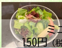
ミニサラダ 150円 (税抜136円)