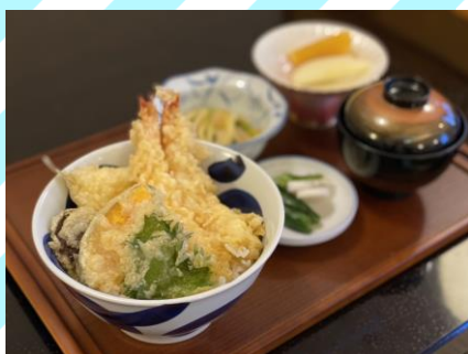
■天丼 850円 (税抜773円) 天丼(海老2本、キス、野菜3点)、 小鉢、漬物、味噌汁、フルーツ