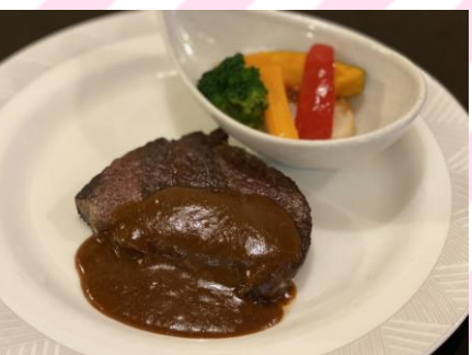
■フィレステーキランチ 1800円 (税抜1636円) 国産牛フィレ110g、ライス、 カップスープ