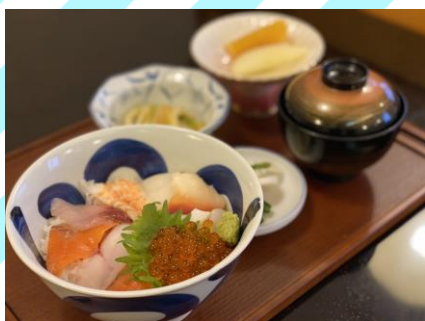
■海鮮丼 900円 (税抜818円) 海鮮丼、小鉢、漬物、味噌汁、 フルーツ