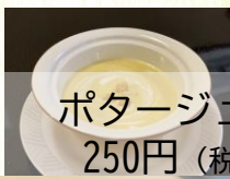
ポタージュスープ 250円 (税抜227円)