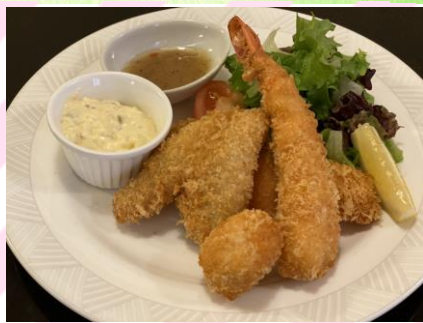
■ミックスフライランチ 850円 (税抜773円) フライ(海老、ホタテ、サーモン、 キス) ライス、カップスープ