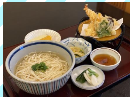
■稲庭うどん 1050円 (税抜955円) 稲庭うどん、小鉢、漬物、フルー ツ、天ぷら(海老2本、野菜3点) 5月1日~9月30日はざるも選べます