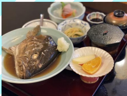
■あら煮つけ定食 900円 (税抜818円) あら煮つけ、刺身、小鉢、漬物、 味噌汁、フルーツ