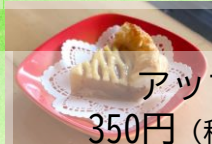
アップルパイ 350円 (税抜318円)